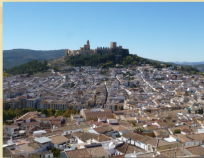
La Mota desde los Llanos

En la actualidad es un referente dentro de las Rutas culturales de Andalucía y el conjunto más grande y mejor conservado de urbanismo hispanoárabe.